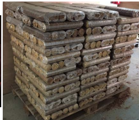
Illustration d'une palette de bois